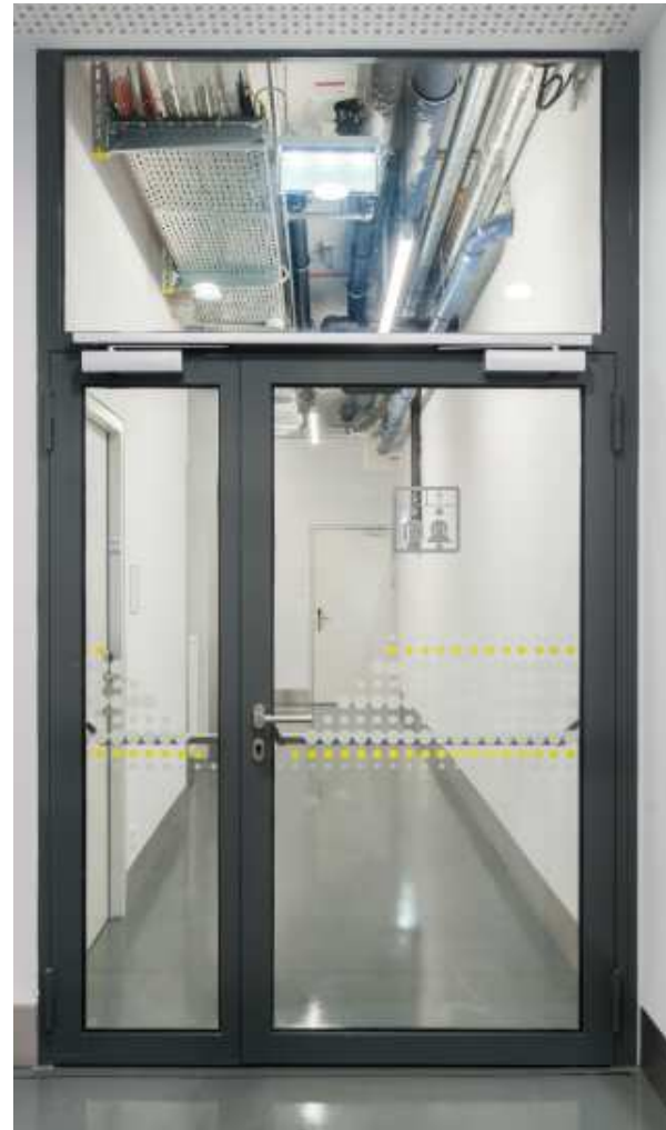
Согласно ГОСТ Р 57327-2016

5.5 Двери должны быть оборудованы устройствами для самозакрывания (доводчиками, пружинными петлями и т.п.), а для двупольных дверей, оба полотна которых активно используются в процессе эксплуатации, дополнительно устройством координации последовательного закрывания полотен.